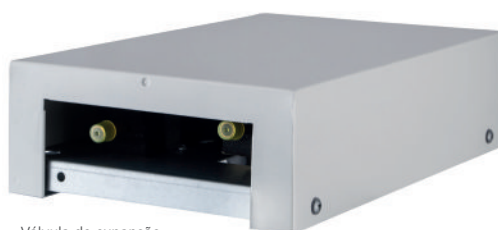
Válvula de expansão