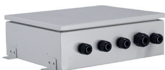
Caixa de controle

Uma interface que permite a ligação de unidades de tratamento de ar com uma bateria de expansão direta às unidades externas GMV5. Cada kit UTA está equipado com uma válvula de expansão, caixa eletrónica e controlo. Este kit completo (sondas e comando incluídos) é utilizado para tratar a temperatura do ar de ventilação.